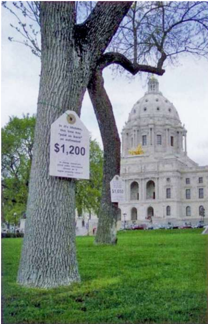
Washington: Preisschilder zeigen den über i-Tree ermittelten ökologischen Wert des Baumes.