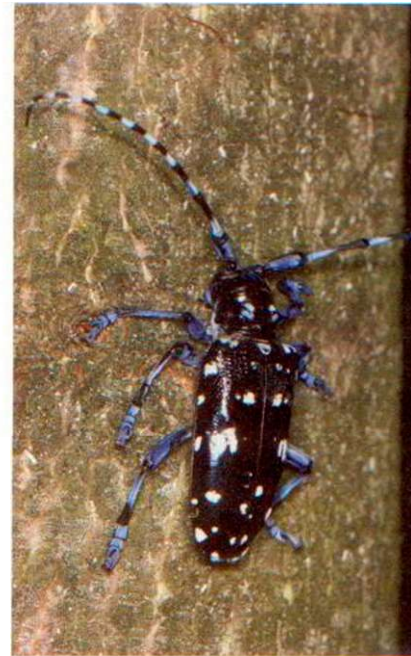
Der bisher einzige in der Schweiz bekannt gewordene Fund eines adulten Citrusbockkäfers.

Die beiden Käfer haben ein grosses Wirtsspektrum von über 100 Gehölzpflanzen. In Europa befielen sie bisher vorwiegend Ahorn, Platane, Pappel, Birke, Buche, Rosskastanie, Weide, Hasel, Apfelbäume, ja sogar Rosenstöcke und verschiedene Sträucher. Es werden auch völlig gesunde Bäume befallen. Der Befall schwächt die Bäume und macht sie anfällig für Krankheiten und Windbruch. Da sie über mehrere Käfergenerationen immer wieder befallen werden, kann dies bis zu ihrem Absterben führen. Bei Jungpflanzen kann schon ein einmaliger Befall zum Tod führen.