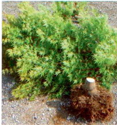
Ein Schnitt oberhalb der Wurzel dieses Fächerahorns zeigt noch nicht, dass er von CLB befallen ist.

Ebenfalls 2000 wurde der Asiatische Laubholzbock erstmals in Europa gefunden. Er wurde in Oberösterreich entdeckt