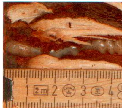
Die Citrusbockkäfer-Larve wird im Bohrgang rund 5 cm gross, bevor sie sich verpuppt.