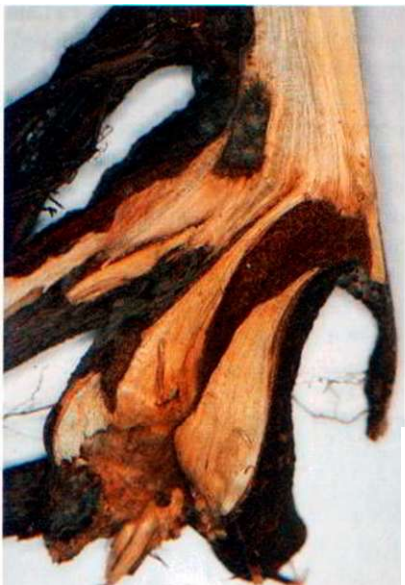
Die Symptome des Citrusbockkäfers finden sich vor allem im Bereich des Wurzelansatzes.