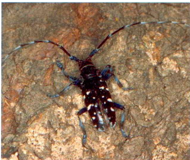
Wie der Citrusbockkäfer ist auch der Asiatische Laubholzbockkäfer auffällig gefärbt.