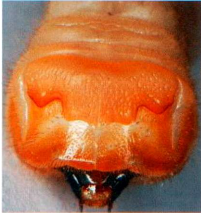
Charakteristische Zeichnung des ersten Brustsegments von Anoplophora -Larven.

Beide Arten werden als besonders gefährliche Organismen in der schweizerischen Pflanzenschutzverordnung (PSV 2001) aufgeführt. Die Einführung eines europäischen Pflanzenpasses vor einigen Jahren soll die Einfuhr von befallsfreien Pflanzen gewährleisten. In der Schweiz muss ein Verdacht auf Befall durch Citrusbockkäfer oder Asiatische Laubholzbockkäfer dem kantonalen Pflanzenschutzdienst gemeldet werden (Meldepflicht gemäss PSV Art. 27). Die befallenen Pflanzen müssen nach der Diagnose vernichtet und die Umgebung auf weiteren Befall abgesehen werden.