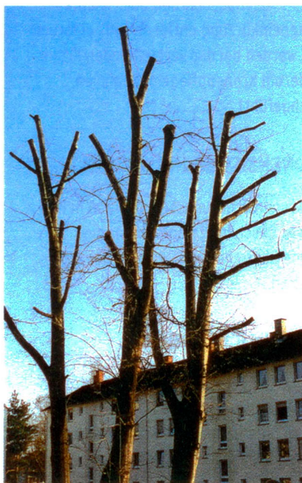
Baumzerstörung durch Kappung

Kappungen führen nicht nur zu Krankheiten, sondern auch zu einem unnatürlichen Aussehen der Bäume. Eine Eiche,