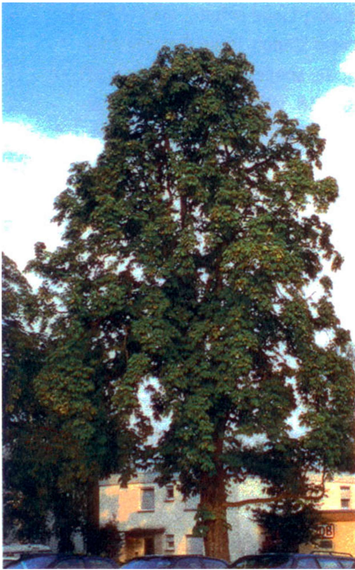
Ein optimaler Standort fördert gesundes Wachstum