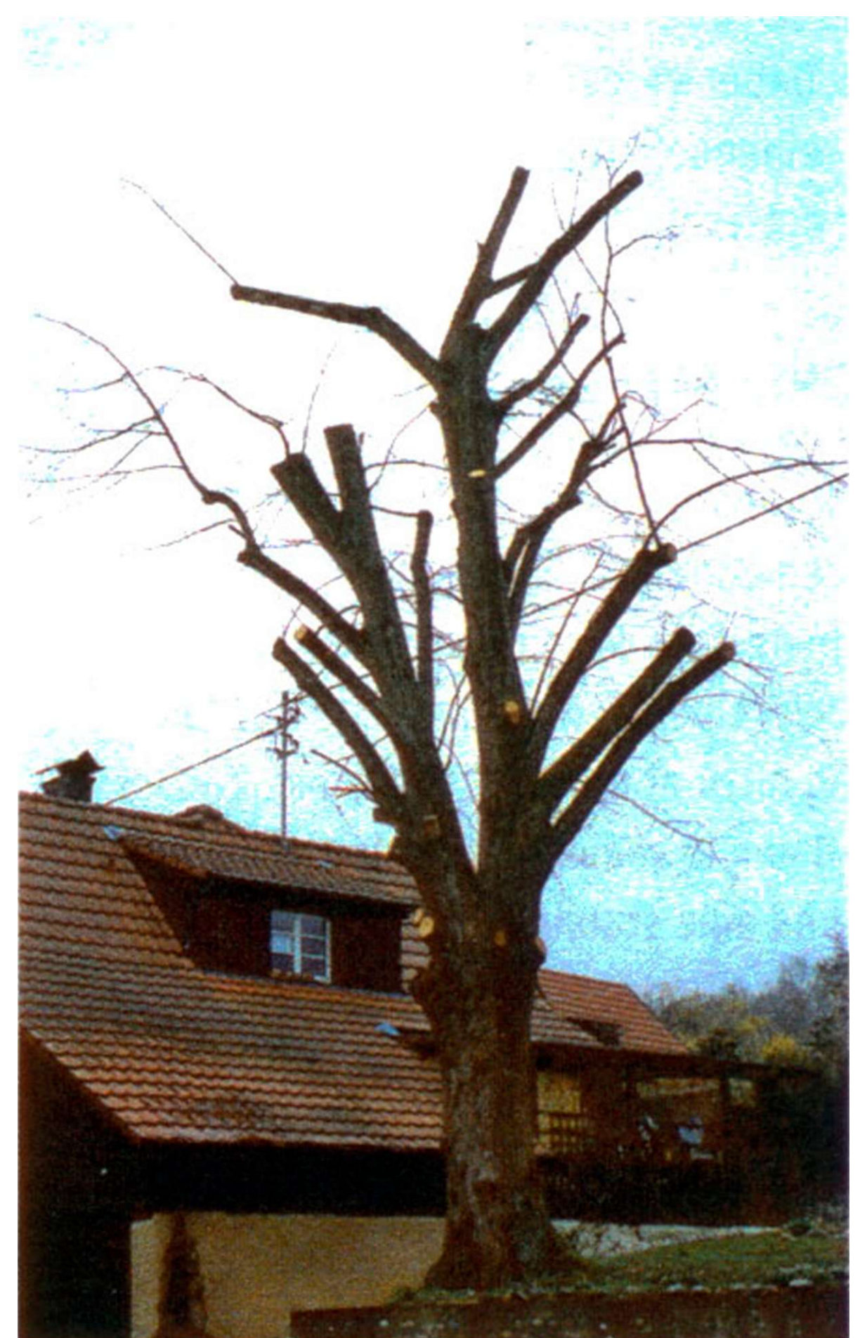
Durch Kappung entsteht zukünftiges Gefahrenpotenzial

Doch nicht immer haben die Baumeigentümer Einfluss auf die Pflanzung der Bäume. Wer ein Haus kauft oder baut, erwirbt den auf dem Grundstück vorhandenen Baumbestand. Auch dieser kann mit fachgerechten Maßnahmen gepflegt werden.