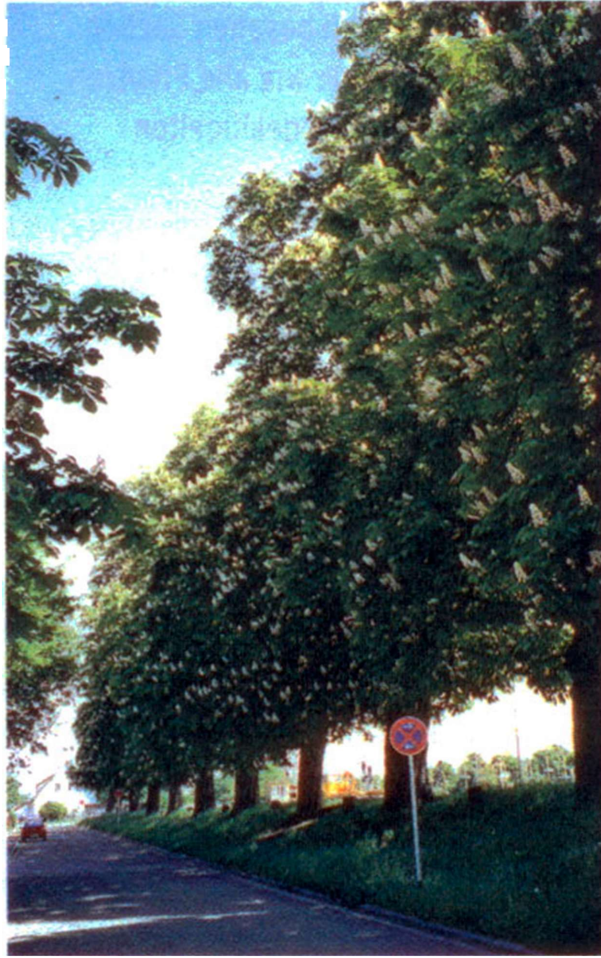
Gut gewachsen durch regelmäßige Baumpflege