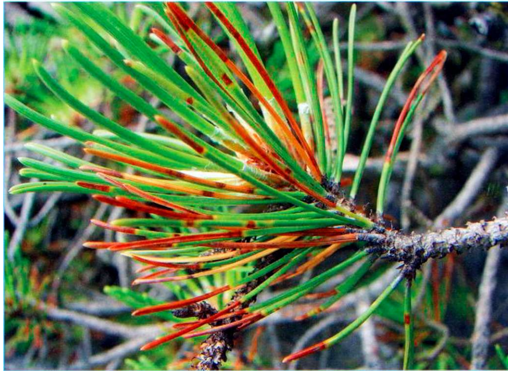
Die Krankheit verursacht braune Flecken mit gelbem Rand, die Nadeln werden braun.

Text und Bilder: Alexander Angst, Eidg Forschungsanstalt für Wald, Schnee und Landschaft WSL/Waldschutz Schweiz, Birmensdorf