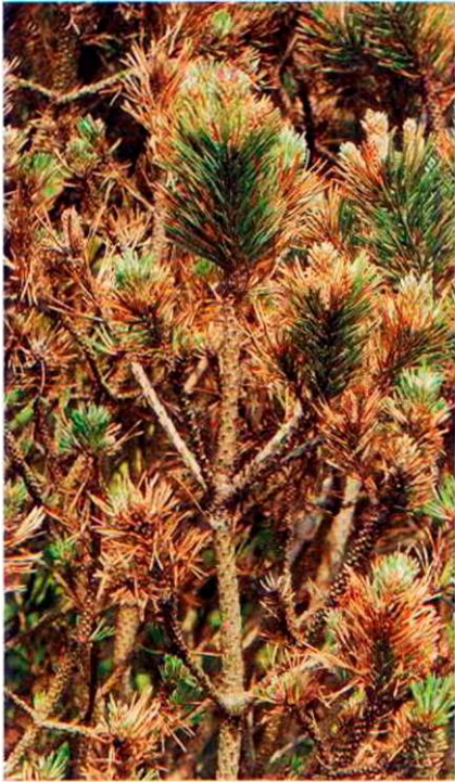
Typisches Symptombild: Zuerst werden die älteren Nadeljahrgänge braun.