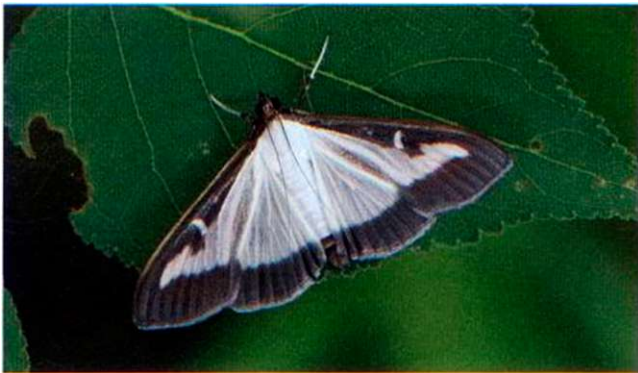
Mittels Pheromon-Fallen können die Flugaktivitäten der Buchsbaumzünsler-Falter überwacht werden.

Da es nicht möglich ist, diesen Schädling grossflächig zu bekämpfen, muss auf lokaler Ebene gehandelt werden. Damit in