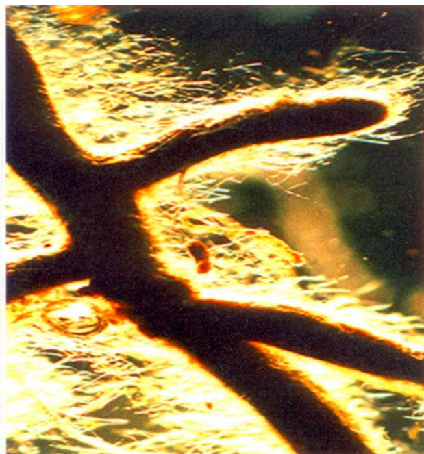
Weit ausstrahlende Pilzfäden ermöglichen eine gute Nährstoff- und Wasseraufnahme.

Mit Hilfe der neusten Methode, die seit 1999 angewendet wird, können mittlerweile Ektomykorrhiza-Impfstoffe auf unsterilen Substraten produziert werden. Hierdurch umgeht man die Schwierigkeiten, dass die Pilzkulturen unter sterilen Anzuchtbedingungen «verweichlichen», da sie sich weder gegen Konkurrenten durchsetzen müssen, noch besondere Mühe für den Nahrungserwerb geben müssen. So können aus Mykorrhizapilzen Lebewesen werden, die sich rein saprophytisch ernähren, das heisst, ausschliesslich von toter organischer Substanz leben. Zugleich ist es möglich, eine Reihe von sehr leistungsfähigen Pilzarten zu nutzen, die unter sterilen Bedingungen kein ausreichend schnelles Wachstum zeigen.