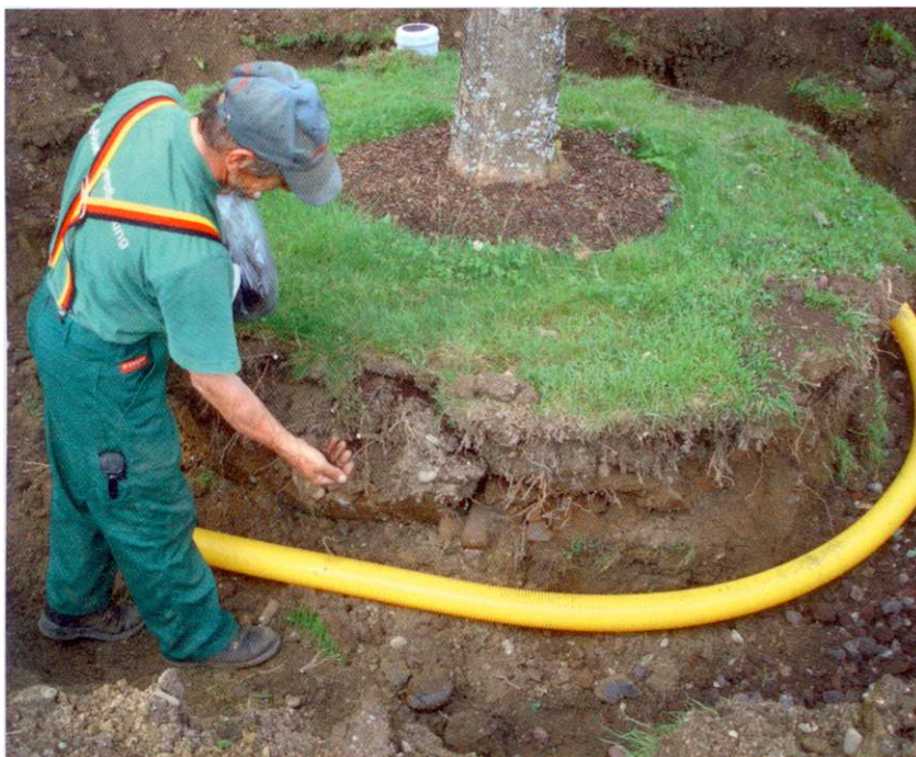
Beispiel einer Altbaumsanierung.