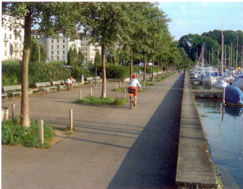
Besonders Stadt- und Strassenbäume sind auf eine externe Zugabe von Mykorrhiza angewiesen.

Die Auswahl des Mykorrhiza-Pilzes muss der Pflanzenart angepasst sein, damit eine Symbiose erfolgen kann. Die Firma Hortima verfügt über eine Liste, die angibt, welcher Pilz zu welcher Baumart passt. Siehe im Internet unter www.hortima.ch .